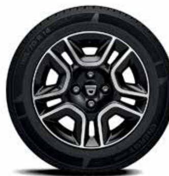
JANTE DORIA 14"