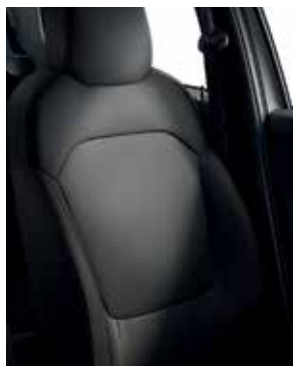
PIELE SINTETICĂ, CULOARE NEAGRĂ